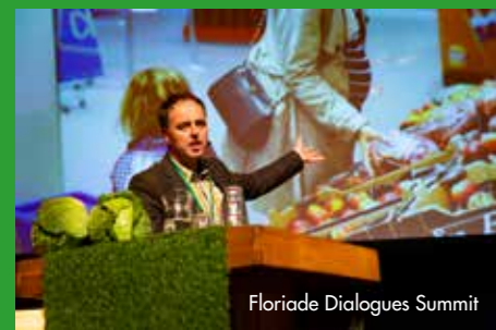
Floriade Dialogues Summit

Hieronder een greep uit de vele en diverse activiteiten. Allemaal onderdeel van de 'Making Of' in de aanloop naar de Expo in 2022.