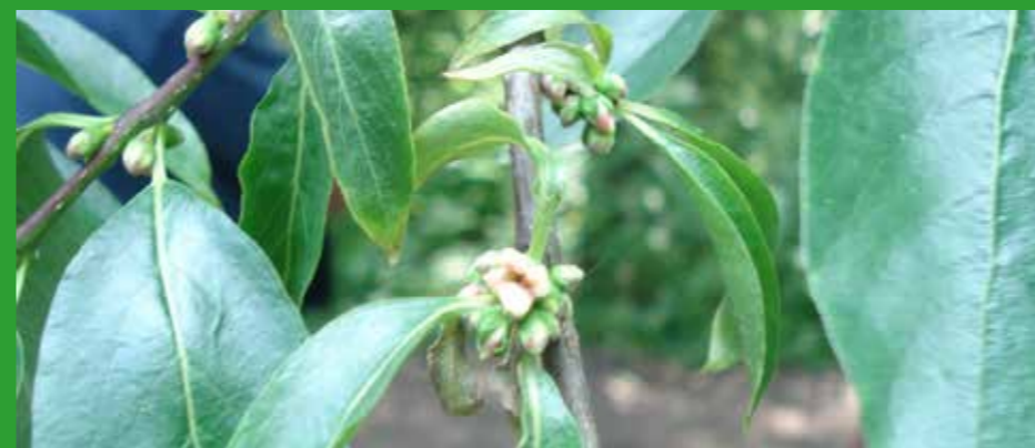
De arboretum rubriek.