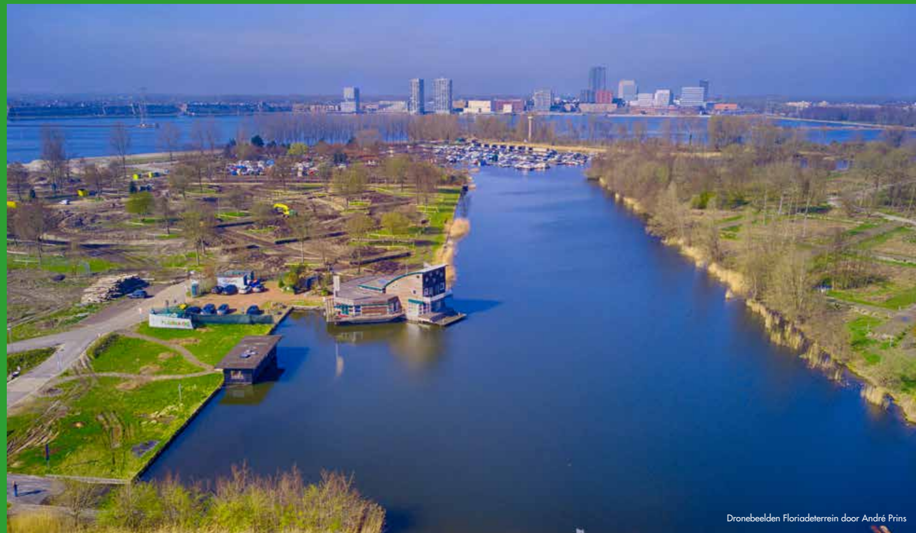
Dronebeelden Floriadeterrein